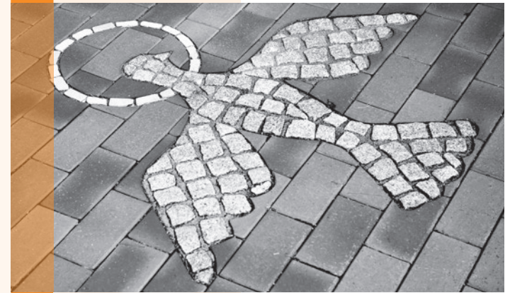
Titelfoto: Steinmosaik der Friedenskirche in Trappenkamp Innen: ©Okumenisches Forum HaterCity, Künstlerin Claudia Reich

Bei Absagen nach dem 14. April 2017 müssen wir Ihnen eine Ausfallgebühr von 50% des Teilnahmebeitrages berechnen, wenn keine Interessenten von der Warteliste nachrücken können.